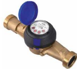
Рис. 2 Лічильник води JS